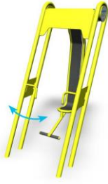
(d) Lappset, Box M, 1891€