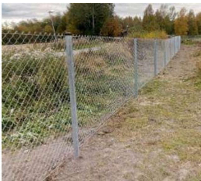
Kuva 1. Tyyppikuva alueelle rakennettavasta teräsverkkoaidasta.

Nykyisen aidan sisäpuolella louhitaan vielä 1-2 kertaa ennen aidan purkamista. Louhinta edeltävän maa-ainesluvan mukaisen aidan sisäpuolella ei vaaranna turvallisuutta.