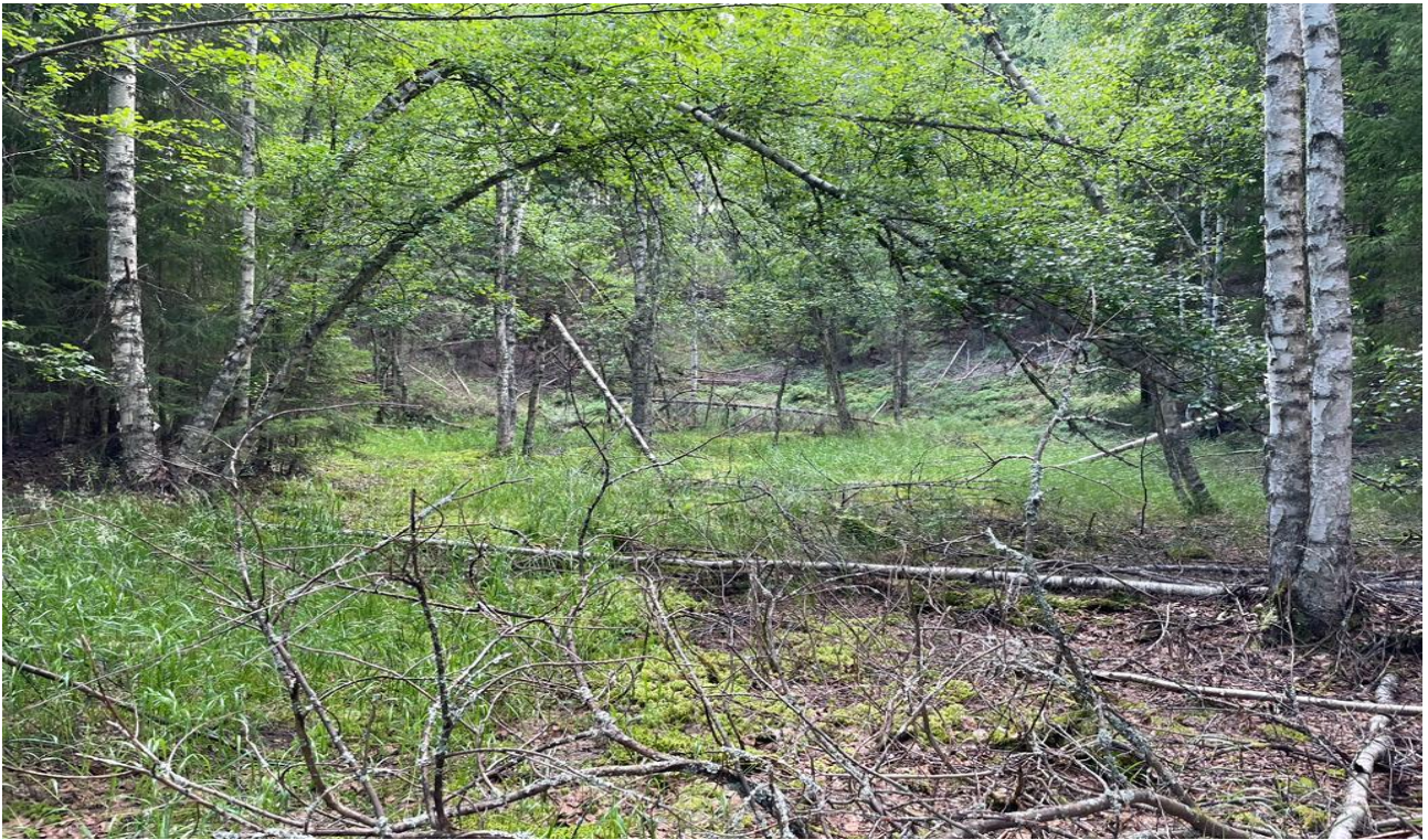
Supan rinnettä, ei harvennustarvetta