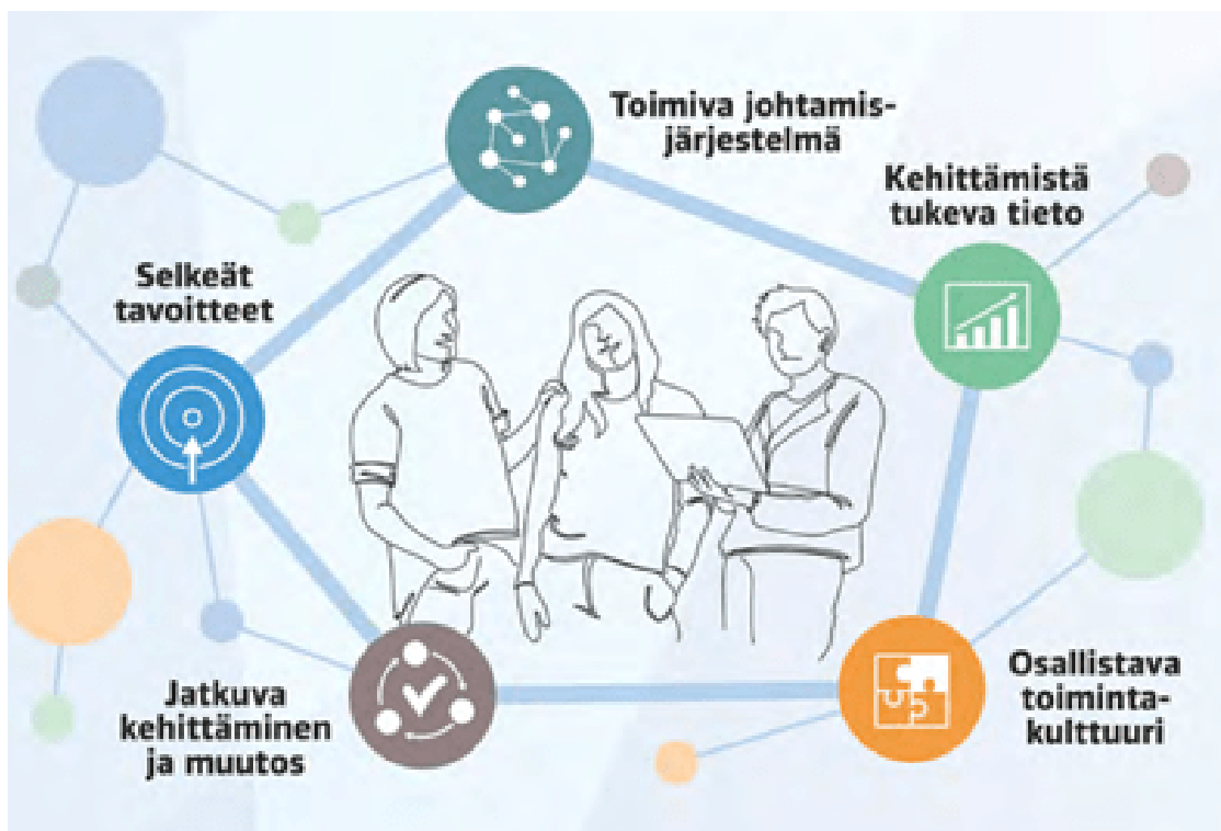
Laatutyön keskeiset elementit.

Sosiaalinen yhteenkuuluvuus -tutkimushankkeessa kartoitetaan 5. luokan oppilaiden ja opettajien kokemuksia kiusaamisesta ja ennakkoluuloista. Tutkimuksen tavoite on selvittää syrjintään ja kiusaamiseen liittyvien asenteiden yleisyyttä ja syntymekanismeja. Lisäksi tutkimushankkeessa arvioidaan ennakkoluuloja käsittelevien työpajojen vaikuttavuutta. Tutkimuksen tekevät Aalto-yliopiston ja Harvardin yliopiston tutkijat. Karvi toteuttaa kyselyt yhteistyössä Turun yliopiston Oppimisanalytiikan tutkimusinstituutin kanssa. Ensimmäiset kyselyt otoskoulujen 5. luokan oppilaille ja heidän opettajilleen toteutettiin syksyllä 2021. Toisen kerran kyselytutkimus toteutettiin lukuvuonna 2022–2023. Seuraavat kyselyt järjestetään syksyllä 2023 ja keväällä 2024. Otoskouluja on tiedotettu kyselyjen tarkemmasta aikataulusta.