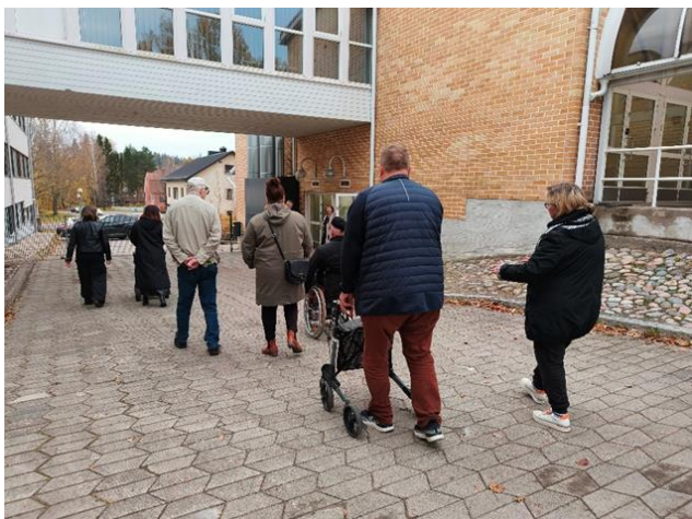
Yhteiskoulun sivuoven sisäänkäynti.