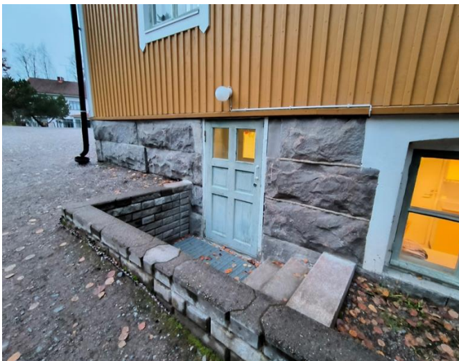
Haukkamäen koulun terveydenhoitajalle pääsy on esteellinen. (Kuva alla.)